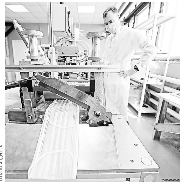
Новая линия способна выпускать 75 тысяч медицинских масок в сутки.

—Мы обсудили возможность распространения этой практики и на других производителей, — добавил чиновник. ■